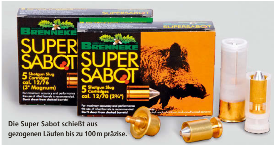
Die Super Sabot schießt aus gezogenen Läufen bis zu 100m präzise.