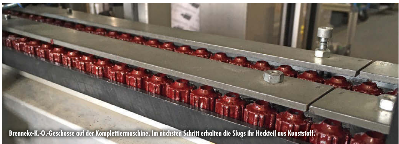
Brenneke-K.-O.-Geschosse auf der Komplettiermaschine. Im nächsten Schritt erhalten die Slugs ihr Heckteil aus Kunststoff.