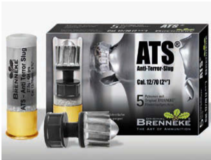
Der Anti Terror-Slug bringt an der Mündung 3578 Joule.