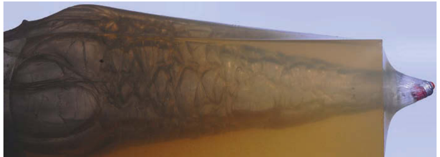
Ein Brenneke Special Forces durchheilt einen 40-cm-Gelatineblock.