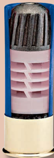
Ein typischer Foster-Slug 12 2 3/4, hier aus der Munitions-Reihe American Gunner.