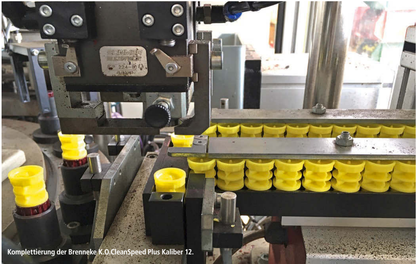
Komplettierung der Brenneke K.O.CleanSpeed Plus Kaliber 12.