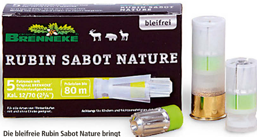
Die bleifreie Rubin Sabot Nature bringt auf 50m mit 1888Joule 10 Prozent mehr Leistung als eine Brenneke Classic im Kaliber 12.