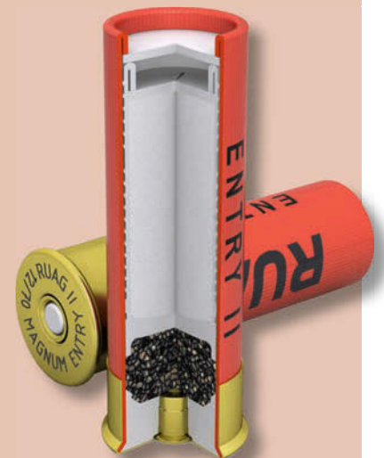
Das Breacher-FLG „Entry II“ von RUAG Ammotec aus gepresstem Zink-Pulver.