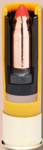
Ein unterkalibriger SST-Sabot Slug von Hornady, hier im Kaliber 20/70.