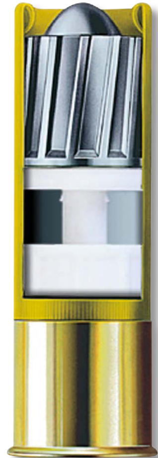
Brenneke SuperMagnum im Kaliber 20.

Dies bedeutet einen um 21,8 Prozent höheren Impuls. Selbst beim Vergleich von der 9,3 x 62 mm (19-g-TUG) und der 39,0 g Brenneke SuperMagnum schneidet letztere auf 25 m mit 14,94 kg \times m/s gegenüber 13,78 kg \times m/s mit einem Plus von 8,4 Prozent besser ab: Die Auftreffenergie ist je nach Modell bis zu einer Entfernung von circa 50 m höher als die der Kugel. Der zweite Grund liegt in der Art der Energieabgabe im Ziel. Während sich das TUG mit einem Durchmesser von 7,82 mm erst mit Verzögerung aufpiltzt, stanzt das Classic-FLG einen Schusskanal von 18,5 mm Durchmesser, verformt sich aufgrund der Bleilegierung nur geringfügig und gibt so gut wie keine Splitter ab. Dadurch hat es eine gewaltige Sofort- und Tiefenwirkung mit Ausschuss – ohne nennenswerte Zerstörung des Wildbrets. Beide Faktoren spielen gerade bei Drückjagd, Nachsuche und Fangschuss eine erhebliche Rolle. Vor dem Hintergrund des jagdlichen Erfolges mit der Brenneke stellt sich die Frage des