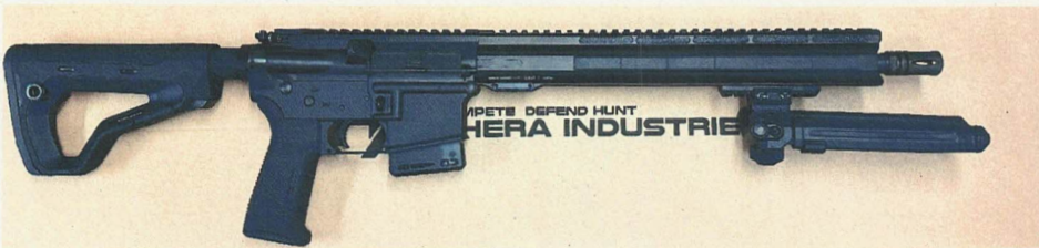
Abbildung 4: H.E.R.A. GmbH, „HDR“ mit den o. g. Merkmalen mit Zweibein