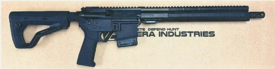
Abbildung 1: H.E.R.A. GmbH, „HDR“ mit den o. g. Merkmalen ohne Zweibein oder Handstopp