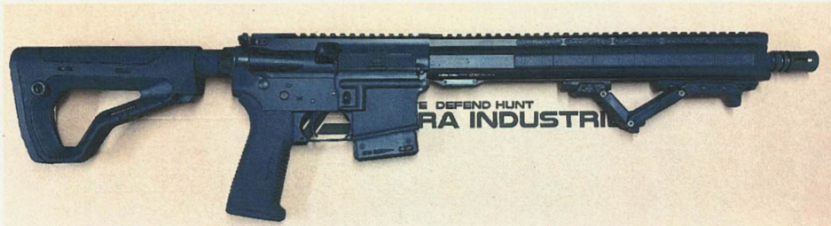
Abbildung 2: H.E.R.A. GmbH, „HDR“ mit den o. g. Merkmalen mit Handstopp-Alternative 1