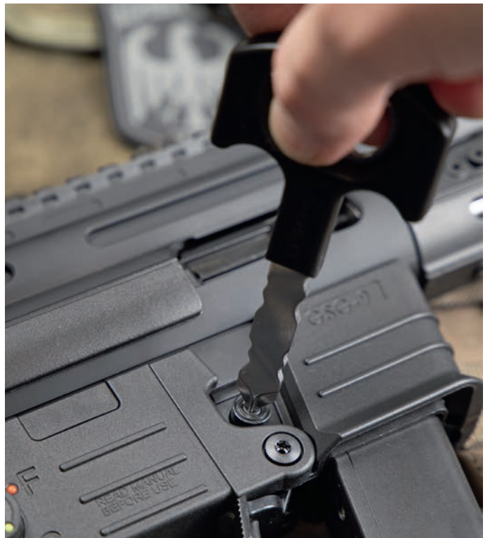
Zwerg mit Zusatznutzen: GSG-9-OPS-Tool in diskreter Schlüsselform.

schneider bestens für das sichere, leichte Durchtrennen von Sicherheitsgurten, Seilen und Textilien. Das 133 Gramm schwere Allroundtool wird durch einen Glasbrecher ergänzt. Die Klinge fährt federunterstützt