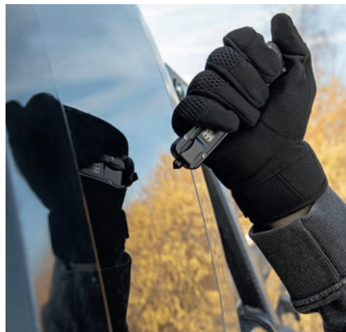
Drei verschiedene taktische Handschuhe, auch mit Schnittschutz (Schutzklasse EN388:F), erweitern die Linie. Die Modelle GSG-9 TS1, GSG-9 CR2 CTR1 und -2 kosten zwischen 39,95 bis 69,95 Euro.

Schnittig präsentiert sich die brandneue GSG-9 Defence-Linie mit hauseigener, hochwertiger Sicherheitsausrüstung für Sicherheitsfachkräfte und Outdoor-Enthusiasten. Die Serie startet mit feststehenden und klappbaren Messern, Multifunktions- und Rescue Tools sowie – auch schnittfesten – Handschuhen. In der Entwicklung befinden sich laut German Sport Guns (GSG) aber auch taktische Äxte, Kugelschreiber, Kubotan und LED-Taschenlampen (mit integriertem Schriill-Alarm).