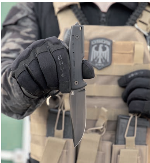
Das „Fixed Blade“-Einsatzmesser EM2 mit Speerspitzenklinge aus D2-Stahl.